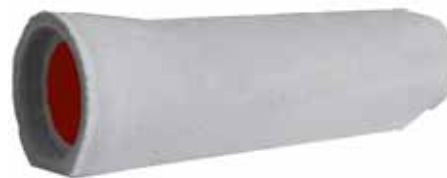
rivestimento interno con resina epossidica